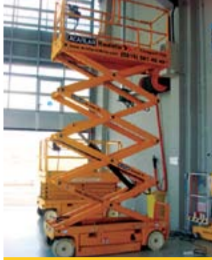
Model Adı: Compact 10N Cinsi: Makaslı Çalışma Yüksekliği: 10 m Model Yılı: 2004 Fiyatı: 11.500 Euro