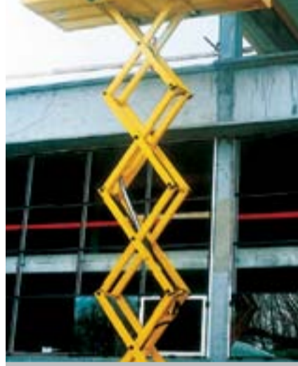
Model Adı: Compact 12 DX Cinsi: Makaslı Dizel Çalışma Yüksekliği: 12,15 m Model Yılı: 2004 Fiyatı: 23.500 Euro