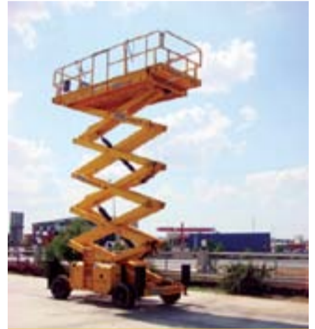
Model Adı: H 18 SX Makaslı Cinsi: Dizel Çalışma Yüksekliği: 18 m Model Yılı: 2004 Fiyatı: 38.000 Euro