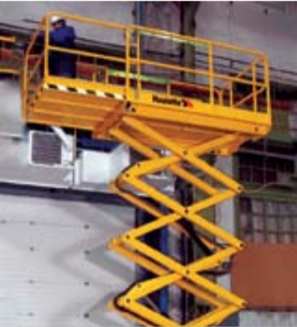
Model Adı: Compact 12 RTE Cinsi: Makaslı Çalışma Yüksekliği: 12,15 m Model Yılı: 2004 Fiyatı: 23.000 Euro