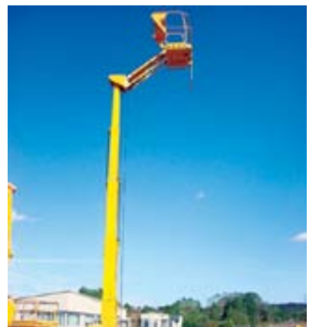
Model Adı: Star 12 Cinsi: Dikey Çalışma Yüksekliği: 12 m Model Yılı: 2005 Fiyatı: 24.000 Euro