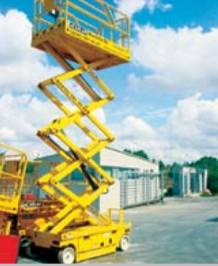
Model Adı: Compact 10 Cinsi: Makaslı Çalışma Yüksekliği: 10,15 m Model Yılı: 2005 Fiyatı: 11.750 Euro