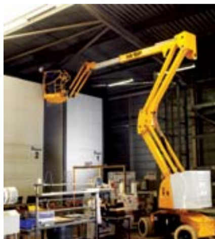
Model Adı: HA 15 IP Cinsi: Makaslı Çalışma Yüksekliği: 10,15 m Model Yılı: 2005 Fiyatı: 34.000 Euro