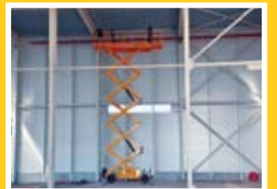
AE Technic: Acarlar Makine ile kolay, güvenilir ve ekonomik yükseliyoruz

Acarlar Makine, temsilciliğini yaptığı markalar arasına bir yenisini daha kattı. Farklı markaların distribütörlüklerini alarak, ürün gamını çeşitlendirmeyi amaçlayan Acarlar Makine, Alman menşeli H.A.B. platformlarının Türkiye'deki yüzü oldu