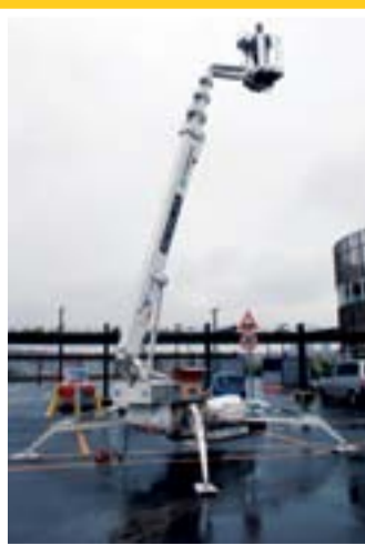
Avrupa'nın en büyük AVM'si Acarlar Makine'yi tercih ediyor

ekleyerek, makaslı platform konusunda bir dünya markası olarak kabul edilen Alman menşeli H.A.B. platformlarının da Türkiye'deki yüzü olduk. 32 m'ye kadar makaslı platform yelpazesi ile hem satış hem de kiralama filomuzda her alacak olan H.A.B. markasını da bünyemize katarak, müşterilerimize çok geniş bir ürün yelpazesiyle çözüm sunmaya devam edeceğiz.