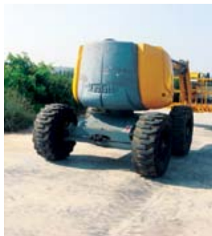
Model Adı: HA 18 PX Cinsi: Eklemlı - Dizel Çalışma Yüksekliği: 17,3 m Model Yılı: 2004 Fiyatı: 44.000 Euro