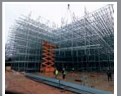
H.A.B. platformları Acarlar Makine güvencesiyle Türkiye'de

Acarlar Makine, temsilciliğini yaptığı markalar arasına bir yenisini daha kattı. Farklı markaların distribütörlüklerini alarak, ürün gamını çeşitlendirmeyi amaçlayan Acarlar Makine, Alman menşeli H.A.B. platformlarının Türkiye'deki yüzü oldu