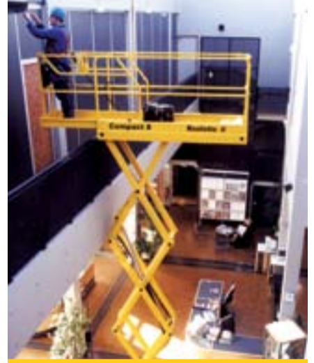
Model Adı: Compact 8 Cinsi: Makaslı Çalışma Yüksekliği: 8,2 m Model Yılı: 2006 Fiyatı: 9.000 Euro