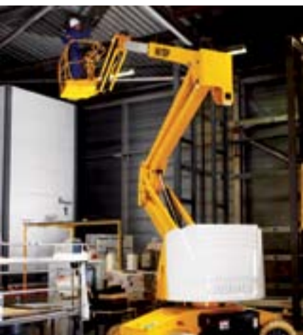
Model Adı: HA 15 IP Cinsi: Makaslı Çalışma Yüksekliği: 10,15 m Model Yılı: 2005 Fiyatı: 33.500 Euro